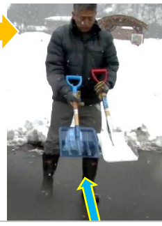
一般的なプラ製搭載スコップ