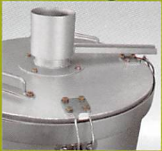
フラットリッド式 (平面仕上)